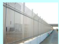
水道施設外周警備